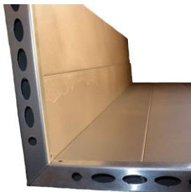
Yhdistä elementit kulmaksi (L-malli)

Kiinnitä palosuojan jalat paikoilleen siten, että lattian kiinnityspalat (E) jäävät jalan ja seinän väliin. Asenna seinäkiinnikkeet kansilistan väliin kuvan mukaisesti.